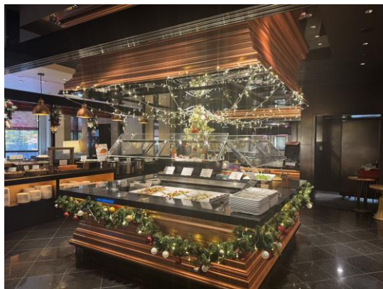
オールデイダイニング「ザ・ガーデンハウス」