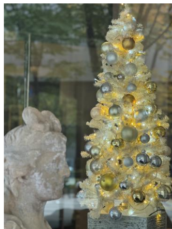
エントランス周辺