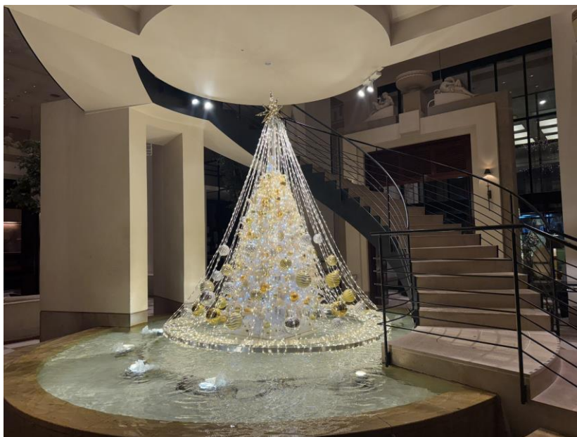
噴水上に漂うアクアツリー

「アクアツリー」は、金沢の冬を象徴する「雪吊り」をモチーフにしており、煌びやかに輝き、水面に浮かぶように漂うツリーは、日中から夜へと時間が進むにつれ異なる雰囲気醸し出します。